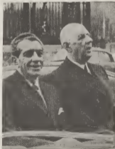
Riba e grafica aki ta aworcu e President frances Charles de Gaulle (drecht) den compania di e President meicano Adolfo Lopez Mateos, durante su bishita na Paris.

E capital extranjero tabata interesa den e posibilidadnan di e sector petroquímico di e industria nacionalizá di e petroleo.